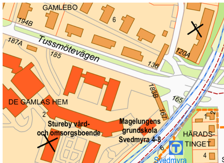
BILD: Kartbild över området med Tussmötevägen 120 och 173 markerade.

På Tussmötevägen 120D inrättade stadsdelsnämnden år 2020 en gruppboestad LSS som fick verksamhetsnamnet Sturebackens gruppboestad LSS. Stadsdelsnämnden hyr lokalen för gruppboestaden av fastighetsnämnden som är innehavare av bostadsrättsandelar i bostadsrättsföreningen Sturebacken. I genomförandeärende, dnr EÅV 2026/24, beslutades att Sturebackens gruppboestad LSS ska flytta permanent till Tussmötevägen 173. Det innebär att lokalerna på Tussmötevägen 120D står tomma efter mars 2026.